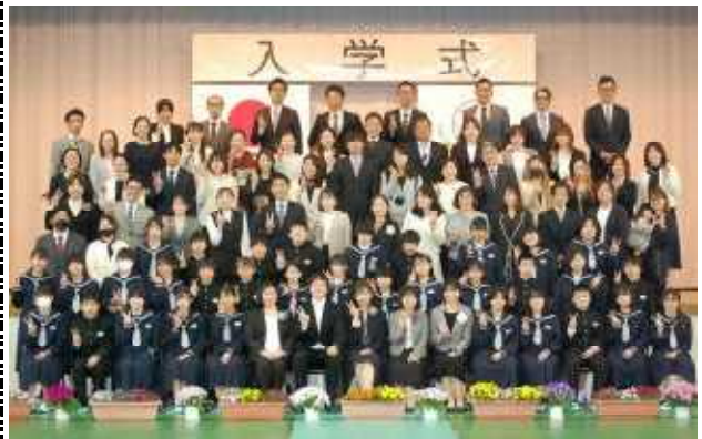
希望を胸に力強い第一歩を踏み出した新入生!!